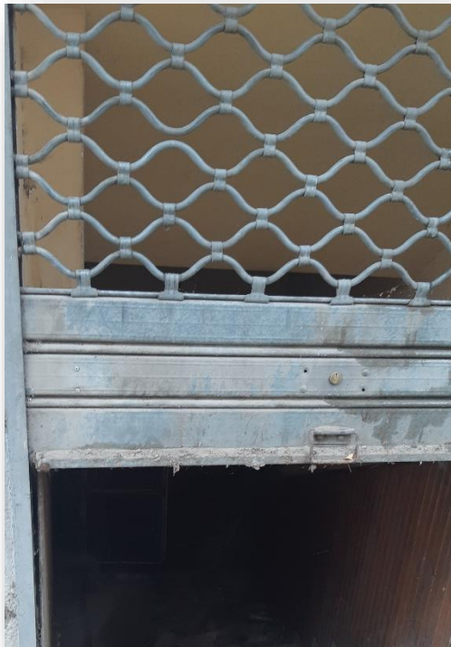
Foto të pasurisë

Objekti – “ Bodrum ” me sip. 85 m 2 është bodrumi i një pallati që ndodhet në rrugën “Ismail Zyla”, rreth 150 m larg universitetit “Aleksander Xhuvani”, në Elbasan. Objekti ka një derë hekuri të jashtme dhe ka nevojë për rikonstruksion. Që prej vitit 2017 pasuria e konfiskuar është nën administrimin e AAPSK. Planimetria .